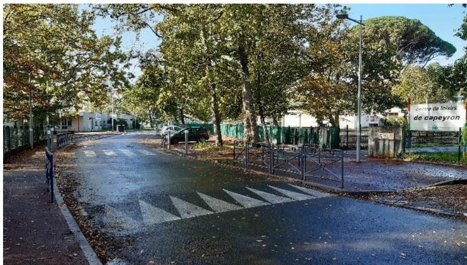
Rue Jean Giono