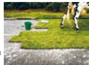
LA MAUVAISE REPUTATION