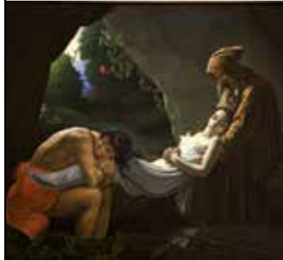
ANNE-LOUIS GIRODET DE ROUCY-TRIOSON, ATALA AU TOMBEAU, AVANT 1850