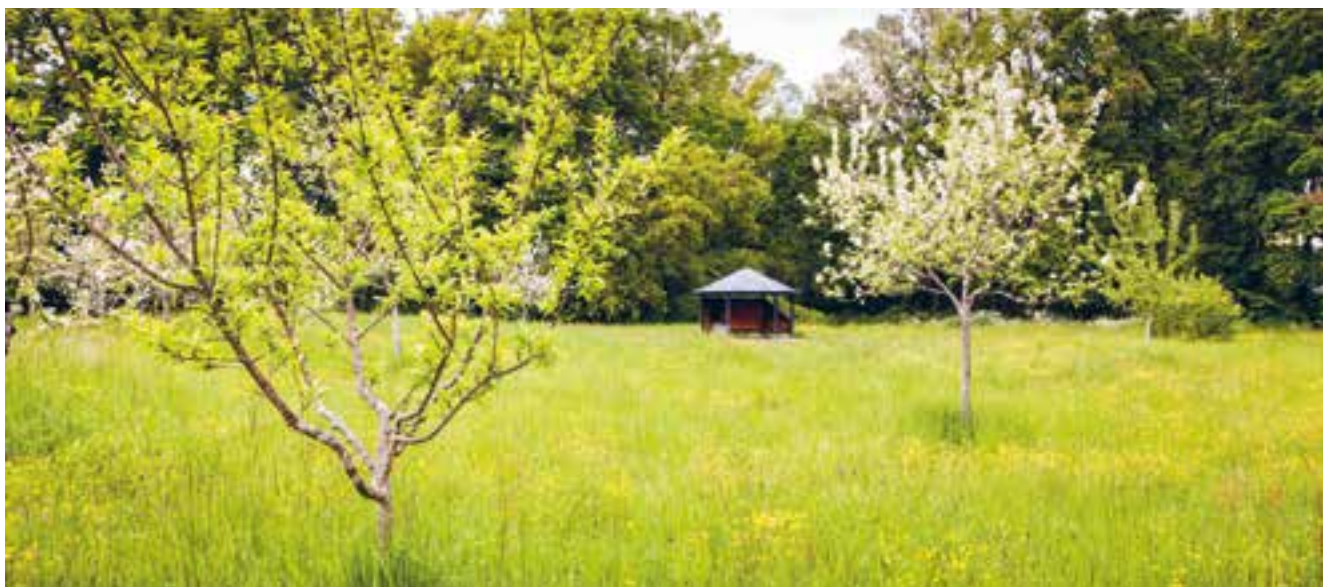
PARC DE LUCHEY DANS LE QUARTIER D'ARLAC