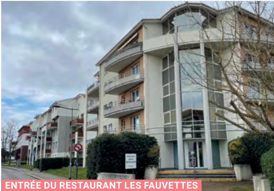
ENTRÉE DU RESTAURANT LES FAUVETTES

Concernant la sortie du 15 octobre, nous reprogrammons la journée à Saint-Seurin-d'Uzet du 18 juin. La priorité sera donnée aux personnes figurants sur la liste d'attente.